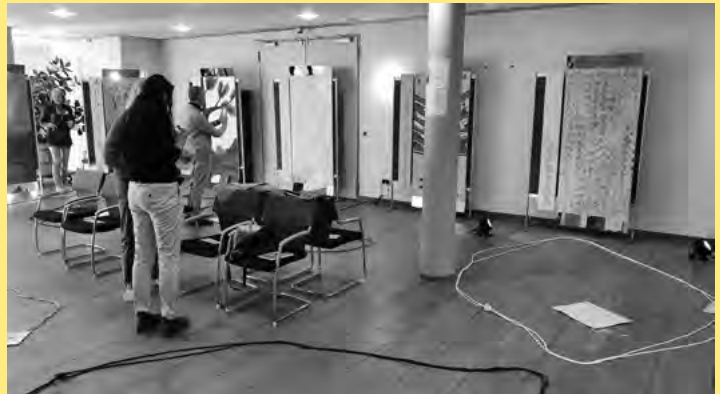
Abbildung 2: Räumliches Setting Uslar 2020 (Werteinstallationen, Kraftfelder, Erdungsstühle)