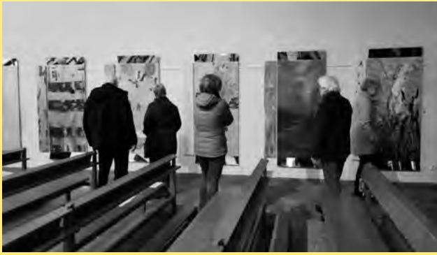
Abbildung 1: Teilnehmende bei systemischer Führung durchs Wertewandel-im-WIR-System