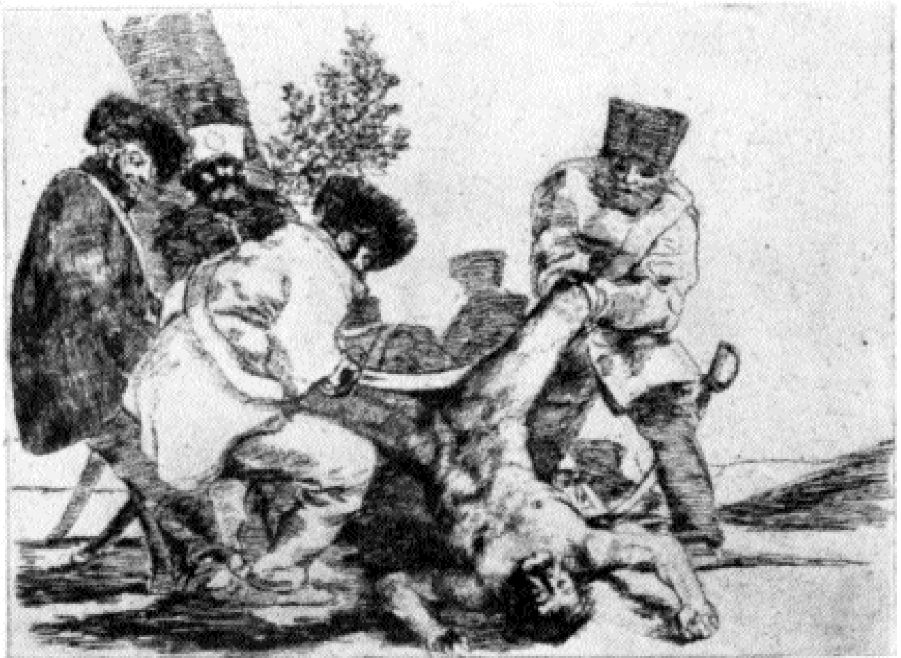
Was kann man noch tun? ( Los Desastres 33)

intellektuellen Elite stützen kann, vom Großteil des spanischen Volkes als ‚Kollaborateure‘ und Nestbeschmutzer angesehen und auch verfolgt.