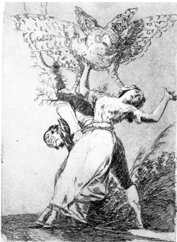
Gibt es niemanden, der uns losbindet? ( Los Caprichos 75 )