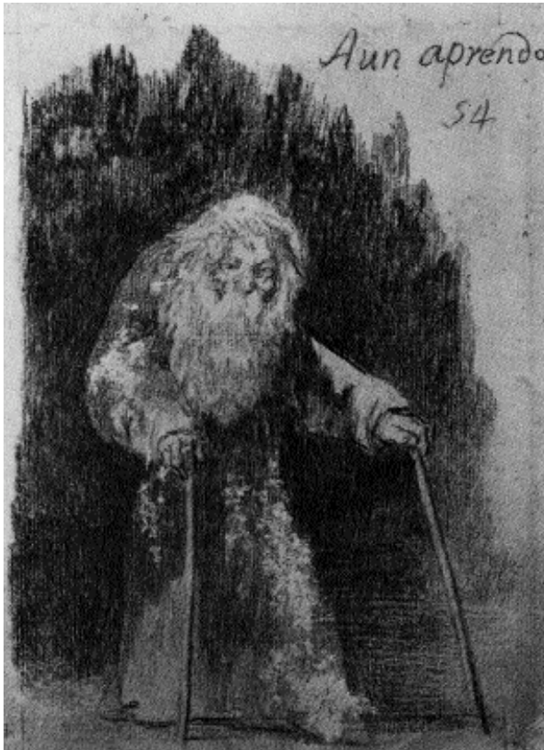
Noch immer lerne ich ( Album G 54 )

dem ebenso langen Bart eine Einheit bildet und vom Gesicht nur Stirn, Augen und Nase freigibt. Die Augen schauen wach und interessiert, gleichzeitig scheint der Blick über beziehungsweise durch das Angeschautete hinauszugehen. Der Alte scheint unterwegs in etwas Jenseitiges und ist doch auch ganz im Diesseits, wo es noch viel zu entdecken, erkunden, lernen gibt. Goya zeigt uns einen Wissenden, dessen Durst auf Neues noch nicht gestillt ist, der, obwohl durch abnehmende körperliche Kräfte behindert, seinen Weg weiter beschreitet. Etwas Heiteres und gleichzeitig Würdiges geht dabei von ihm aus. Ich glaube, man kann getrost annehmen, dass sich Goya selbst in der Darstellung des Greises verbirgt, dass er uns eine Art Zustandsbeschreibung seiner selbst als etwa Achtzigjähriger gibt, seiner nicht nachlassenden Lust, weiterzukommen, Ungekanntes zu erreichen. Wohin ist der Alte unterwegs, zu seiner Art der irdischen Vollendung? Seine listigen Augen lassen es vermuten, die Würde seiner ungebrochenen Haltung. Und vielleicht zeigt er uns, dass nicht das ‚Immerstrebend-sich Bemühende‘ zur Weisheit führt, sondern das Nichtnachlassen des Veränderungswillens.